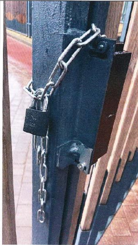
Въездные ворота на территорию комплекса Дата снимка: 25 апреля 2021 года