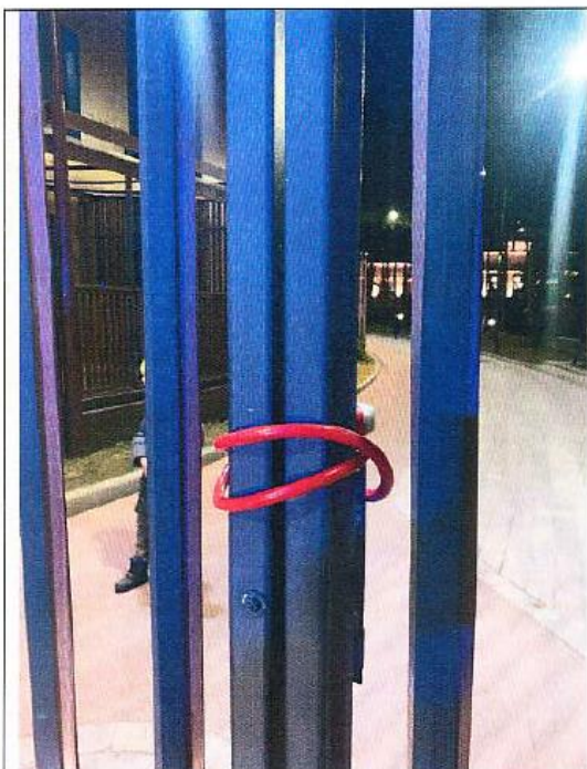
Въездные ворота на территорию комплекса Дата снимка: 17 апреля 2021 года