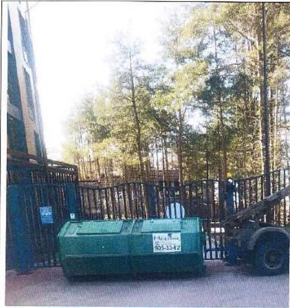
Въездные ворота на территорию комплекса Дата снимка: 20 апреля 2021 года