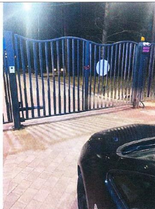
Въездные ворота на территорию комплекса Дата снимка: 17 апреля 2021 года