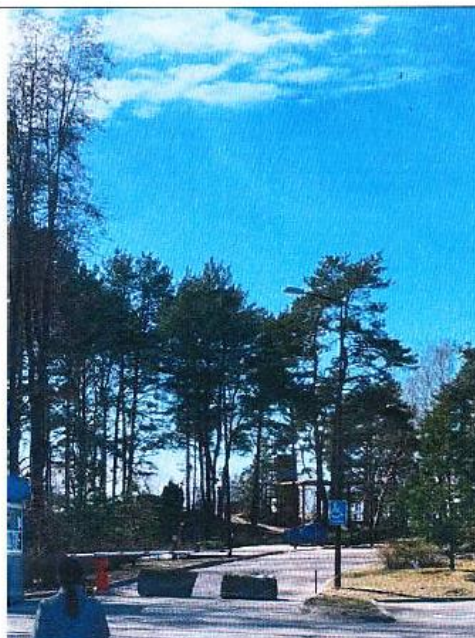
Въезд на временную наземную парковку №1 Дата снимка: 17 апреля 2021 года