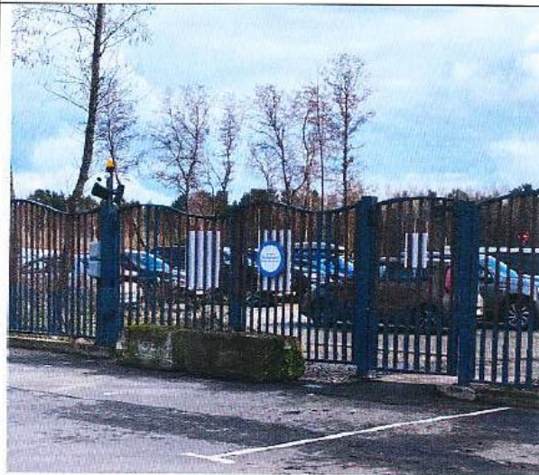
Выезд на муниципальную парковку №2 Дата снимка: 23 апреля 2021 года