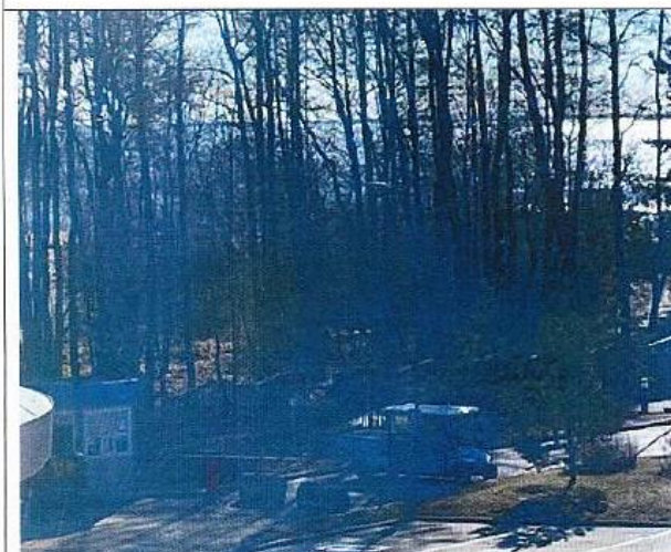
Въезд на временную наземную парковку №1 Дата снимка: 17 апреля 2021 года