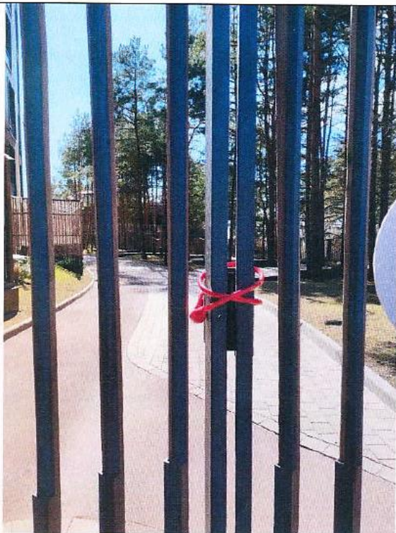
Въездные ворота на территорию комплекса Дата снимка: 19 апреля 2021 года