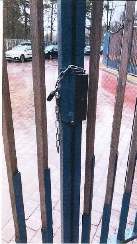
Въездные ворота на территорию комплекса Дата снимка: 25 апреля 2021 года