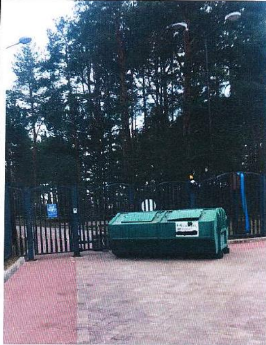
Въездные ворота на территорию комплекса Дата снимка: 21 апреля 2021 года